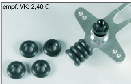
empf. VK: 2,40 €

Thick-walled teflon exhaust hose for manifold-muffler connections with an inside diameter of 21mm. Eventually you have to heat the hose with a lighter when you install it.