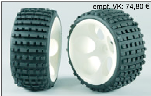
empf. VK: 74,80 €

Narrow Baja Buggy tires 65mm, ready glued on rims. Suitable for all 1:6 Off-Road Buggies. To mount them on FG Off-Road models you need the 14mm square wheel driver 06106/01 and the front axle 06104/01.