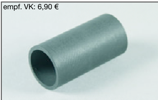
empf. VK: 6,90 €

Wide Baja Buggy tires 80mm, ready glued on rims. Suitable for all 1:6 Off-Road Buggies. To mount them on FG Off-Road models you need the 14mm square wheel driver 06106/01.